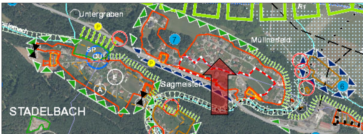
Ausschnitt Örtliches Entwicklungskonzept der Marktgemeinde Weißenstein (Quelle: KAGIS)

Im Örtlichen Entwicklungskonzept der Marktgemeinde Weißenstein wird Stadelbach als Ortschaft mit Entwicklungsfähigkeit u.a. für Wohnfunktion erfasst. Das Planungsgebiet dieser Verordnung befindet sich vollständig innerhalb der absoluten Siedlungsgrenzen. Erweiterungsmöglichkeiten bestehen naturräumlich bedingt lediglich in nordwestliche Richtung.