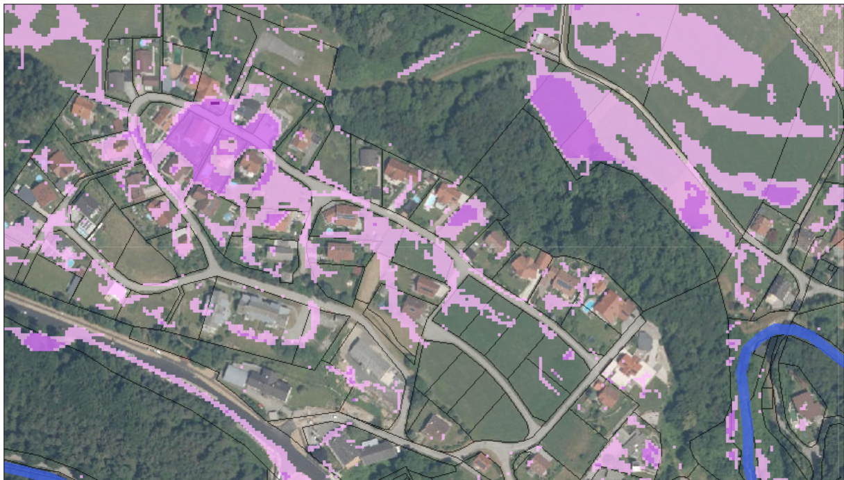
Ausschnitt: Hinweiskarte Oberflächenabfluss

In den zentralen Bereichen des westlichen Planungsgebietes herrscht laut Hinweiskarte Oberflächenabfluss ein hohe Gefährdungsgrad vor, sodass besonderes Augenmerk auf die ordnungsgemäße Verbringung der Oberflächenwasser zu achten ist.