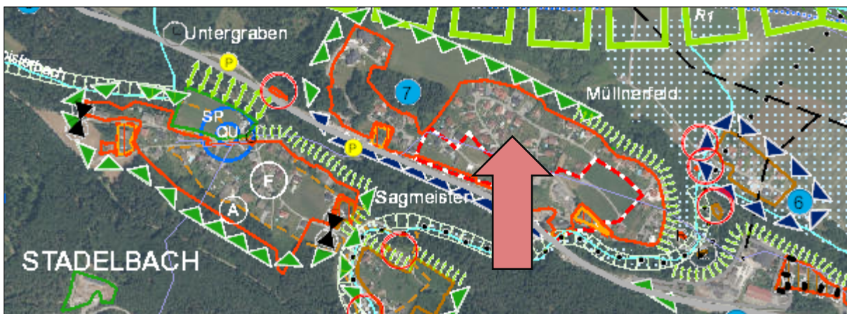
Ausschnitt Örtliches Entwicklungskonzept der Marktgemeinde Weißenstein

Im Örtlichen Entwicklungskonzept der Marktgemeinde Weißenstein wird Stadelbach als Ortschaft mit Entwicklungsfähigkeit u.a. für Wohnfunktion erfasst. Das Planungsgebiet dieser Verordnung befindet sich vollständig innerhalb der absoluten Siedlungsgrenzen. Erweiterungsmöglichkeiten bestehen naturräumlich bedingt lediglich in nordwestliche Richtung.