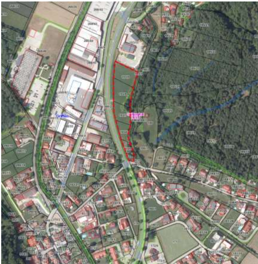
Abb. Planungsraum

Im Naturraum betrifft es eine weitgehend ebene Wiesenfläche, die im Osten an den Alten Wölfnitzbach, im Westen an die B70 und im Norden an den Recyclinghof der Gemeinde Griffen anbindet. Infolge einer bereits durchgeführten Hochwasserschutzmaßnahme befindet sich das Grundstück nicht mehr im Einflussbereich eines HQ100.