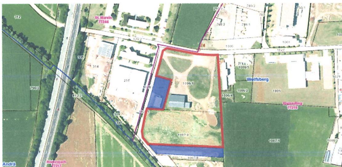
Abb.1 - Darstellung bisheriges Planungsgebiet (ROT) mit den Zukaufflächen (BLAU).

Aufgrund einer Erweiterung des Planungsgebietes um die Grundstücke 1006/3 (westlicher Bereich des Planungsgebietes) und Teilfläche aus dem Grundstück 1007/8 (mittlerweile der Parzelle Nr. 1007/2 zugeschrieben), war es sinnvoll und zielführend diese ebenfalls in den Teilbebauungsplan aufzunehmen.