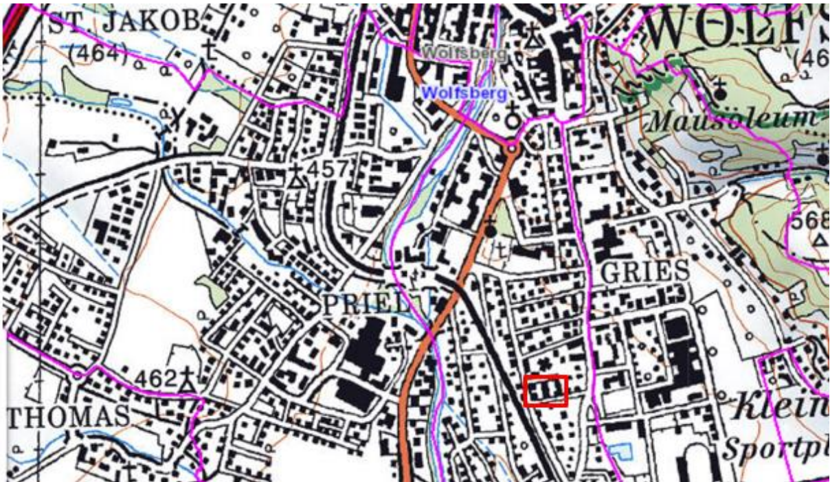
Lage des Planungsgebietes

Das Planungsgebiet liegt im Stadtteil Reding in Zentrum von Wolfsberg. Die Gegend ist charakterisiert durch die Bauten aus den 70er und 80er Jahren. In unmittelbarer Nähe befindet sich einerseits das Ortszentrum als auch das nahe gelegene Schulzentrum.